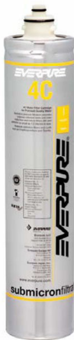
Cartuccia 4C: EV960100

Indicata per la fornitura di acqua di qualità per le seguenti applicazioni: "cold cup vending applications"